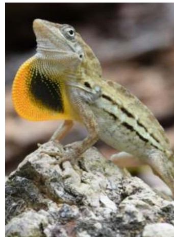
Totèki (gestreepde anolis) Anolis lineatus