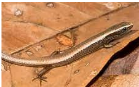
Kolebra di mespel (gestreepde briltegu) Gymnophthalmus lineatus