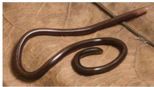
Bichi di nos kabes (wormslang)