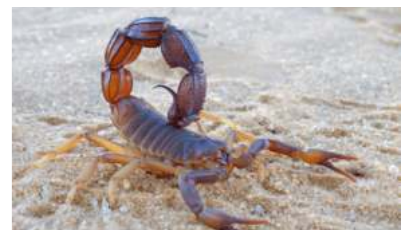
Skarpion pretu (zwarte schorpioen) Didymocentrus hasethi