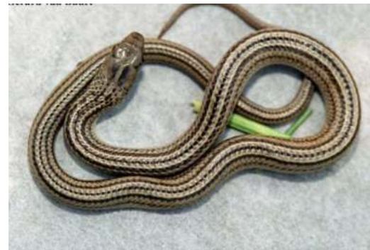
Kolebra di Kòrsou (Curacaose zweepslang) Erythrolamprus triscalis