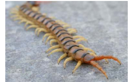
Lísimbein (duizendpoot) Scolopendra gigantea