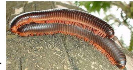
Lísimbein (miljoenpoot) Trigoniulus corallinus