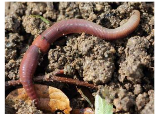
Bichi awa seru (Regenworm)