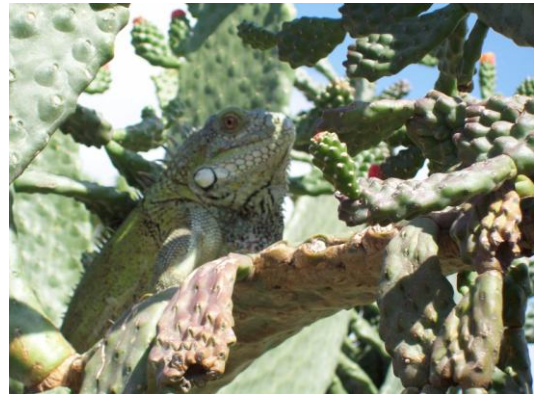
De perfecte schutkleur....