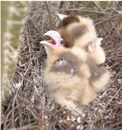
puitu di warawa

Para ta pertenesé na e grupo di vertebrado, meskos ku piská, rèptil, amfibio i mamal. Pues para tin skelèt interno ku wesu di lomba. Para ta di sanger kayente i e tin pluma pa mantené e calor.