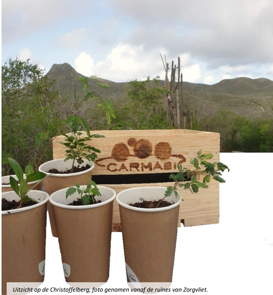
Uitzicht op de Christoffelberg, foto genomen vanaf de ruïnes van Zorgvliet.

In de tuin kunnen bomen te maken krijgen met ongedierte en ziektes. Denk bij het bestrijden van deze kwaaltjes aan de rest van de natuur in de tuin. Kies voor natuurlijke bestrijdingsmiddelen zoals groene zeep, epsom salt (magnesiumsulfaat) en thee gemaakt van neem bladeren.