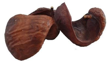
V.l.n.r.: Blad, bloemen en vruchten van Caesalpinia coriaria .