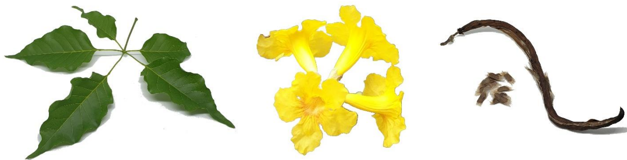
Di man robes pa man drechi: Blachi, flor i fruta di Handroanthus billbergii.

Verzorging: Handroanthus billbergii is een makkelijke boom die goed tegen droogte kan. Geef de boom in het begin regelmatig water, tot de wortels goed zijn ontwikkeld.