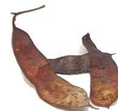
V.l.n.r.: Blad, bloemen en vruchten van Acaciella glauca .