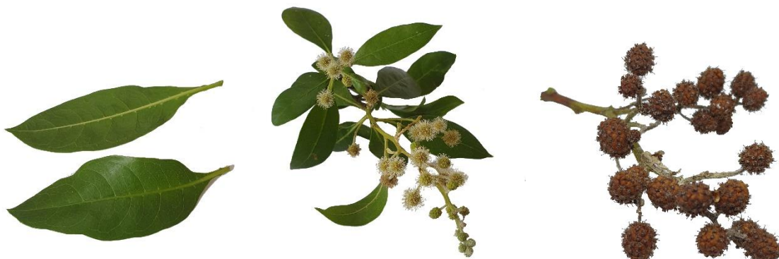
V.l.n.r.: Blad, bloemen en vruchten van Conocarpus erectus .