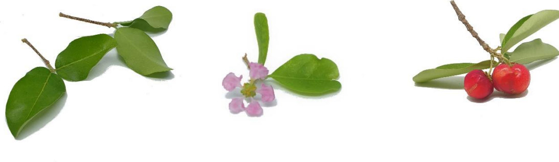
V.l.n.r.: Blad, bloemen en vruchten van Malpighia emarginata .

Verzorging: Malpighia emarginata kan lange dunne takken krijgen als de plant vrij kan groeien en niet regelmatig gesnoeid wordt. Voor een volle bos, dient de plant regelmatig gesnoeid te worden.