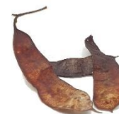
Di man robes pa man drechi: Blachi, flor i fruta di Acaciella glauca .