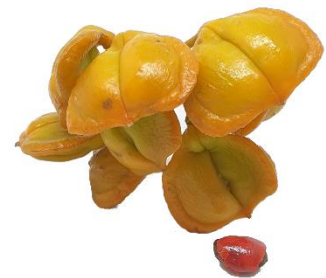
Di man robes pa man drechi: Blachi, flor i fruta di Guaiacum officinale .