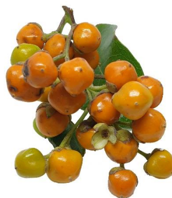
Di man robes pa man drechi: Blachi, flor i fruta di Bourreria succulenta .