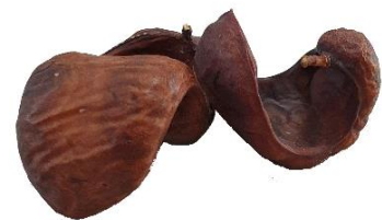
Di man robes pa man drechi: Blachi, flor i fruta di Caesalpinia coriaria.