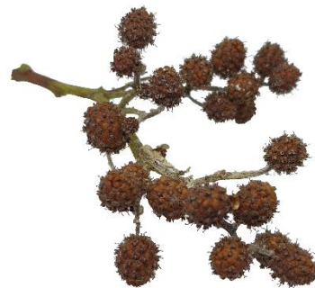
Di man robes pa man drechi: Blachi, flor i fruta di Conocarpus erectus.