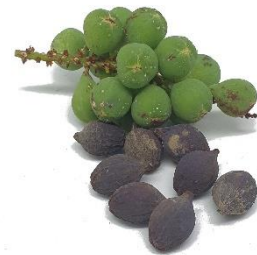
Di man robes pa man drechi: Blachi, flor i fruta di Coccoloba uvifera .