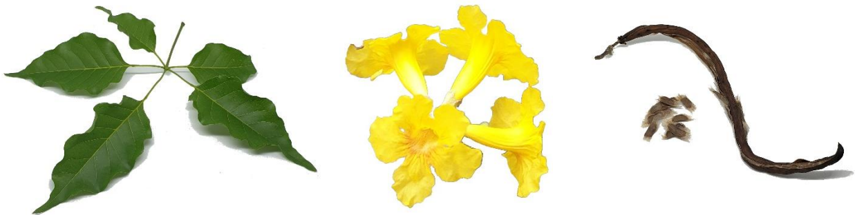
Di man robes pa man drechi: Blachi, flor i fruta di Handroanthus billbergii .

Kuido: Handroanthus billbergii ta un palu fásil ku por bon kontra sekura. Duna e palu bon awa na komienso, pa su raisnan por desaroyá bon.