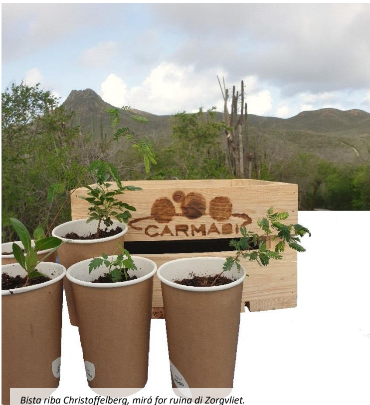
Bista riba Christoffelberg, mirá for ruina di Zorgvliet.

Por sosodé ku un tipo di mata a kaba. Den e surtido di Carmabi kasi sigur tin un alternativa akseptabel. Bisa nos si tin deseonan spesífiko.