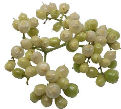
Di man robes pa man drechi: Blachi, flor i fruta di Cordia dentata .