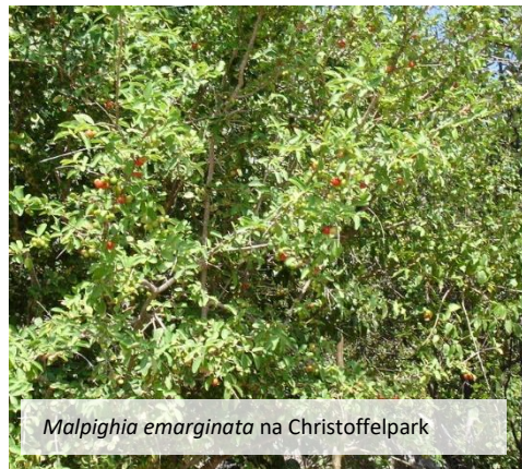
Malpighia emarginata na Christoffelpark

General: Malpighia emarginata ta un mata hopi konosí di Kòrsou, ku su frutanan típiko kòrá, ku ta smak dushi i zür. Segun hopi hende esaki ta e fruta mas dushi di nos isla. No ta solamente hende gusta e frutanan aki, hopi para ta gusta e mata aki i pesei e mata aki lo agregá algu bunita den kurá. Malpighia emarginata ta pèrdè su blachinan ora temporada seku dura hopi, pero asina ku awa kai, e ta un di e promé matanan ku ta haña blachi bèk. E flornan ta bira fruta lihé i por haña e frutanan aki den mondi asina ku temporada di awa kuminsá.