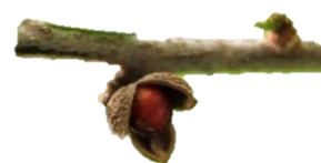
Di man robes pa man drechi: Blachi, flor i fruta di Trichilia trifolia.