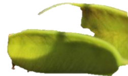
Di man robes pa man drechi: Blachi, flor i fruta di Haematoxylum brasiletto .