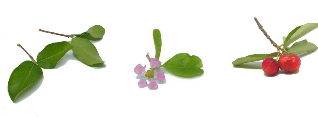
Di man robes pa man drechi: Blachi, flor i fruta di Malpighia emarginata .

Kuido: Malpighia emarginata por haña taki largu i fini si no snui e. Pa e bira un mata yen, mester snui e regularmente.