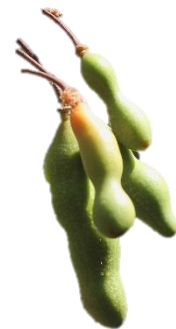
Di man robes pa man drechi: Blachi, flor i fruta di Cynophalla linearis .