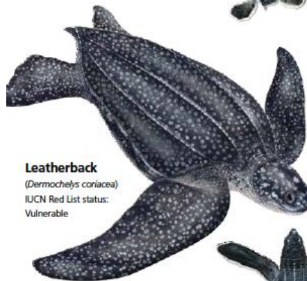
Leatherback ( Dermochelys coriacea ) IUCN Red List status: Vulnerable

Visit www.SeaTurtleStatus.org to learn more about all seven sea turtle species!