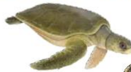
Flatback ( Natator depressus ) IUCN Red List status: Data Deficient

The seven sea turtle species that grace our oceans belong to a unique evolutionary lineage that dates back at least 110 million years. Sea turtles fall into two main subgroups: (a) the unique family Dermochelyidae , which consists of a single species, the leatherback, and (b) the family Cheloniidae , which comprises the six species of hard-shelled sea turtles.