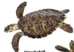
Hawksbill ( Eretmochelys imbricata ) IUCN Red List status: Critically Endangered

Visit www.SeaTurtleStatus.org to learn more about all seven sea turtle species!