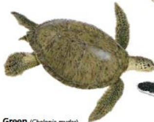
Green ( Chelonia mydas ) IUCN Red List status: Endangered