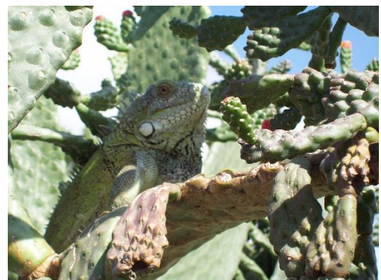
Koló di kamuflahe perfekto ....